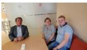
Įsibėgėjusi vasara Naujamies... vilnius.lsdp.lt